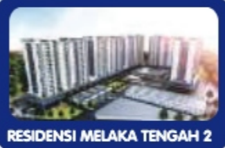
RESIDENSI MELAKA TENGAH 2