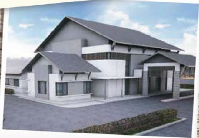
Dewan serba guna