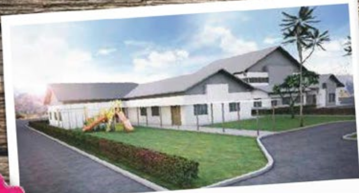
Tadika & Taska

Pembangunan yang menawarkan gaya hidup moden dan kontemporari, lengkap dengan pelbagai fasiliti dan prasarana